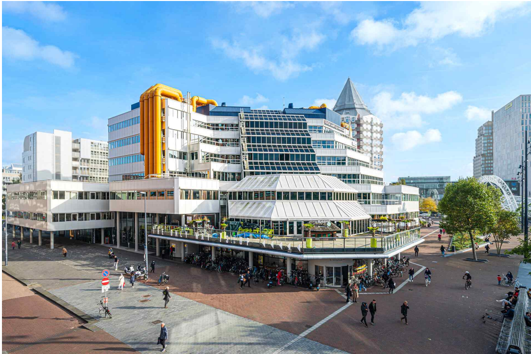
그림 1. 로테르담공공도서관(본관)