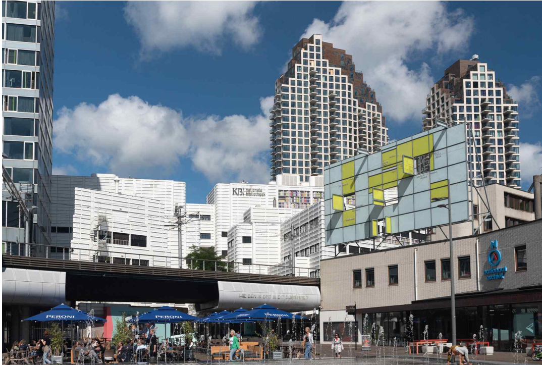
그림 2. 헤이그 소재 네덜란드국립도서관 전경

KB는 공공도서관 네트워크에서 중요한 조정 역할을 한다. 네덜란드 도서관 조직들은 규모, 영토의 크기, 행정 통제 수준(지방, 주, 국가)에서 다르기는 하지만 완전히 분리된 조직은 아니다. 이들은 더 큰 전체 중의 하나로서 네트워크로 연결되어 있다. 네트워크에서 함께 일하는 것은 네덜란드 도서관 시스템의 본질적인 특징이며, 이는 지난 몇 년 동안 강화되었다.